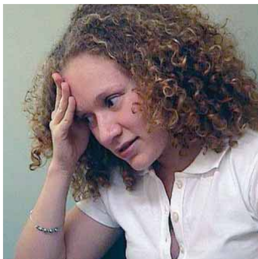
"We onderzoeken waarom veel starters op mbo-niveau niet zo lekker in hun vel zitten en hoe we dat probleem kunnen aanpakken."

We richten ons op de groep met mbo-niveau twee tot en met vier. Juist die groep wordt een beetje genegeerd. Ze zitten nog midden in het ritme van stappen en hangen met vrienden, zijn vaak redelijk makkelijk aan hun diploma gekomen en krijgen dan opeens te maken met vaste werktijden, leidinggevend en eigen verantwoordelijkheden die ze niet gewend zijn. Vaak is de oorzaak van het probleem dat ze heel